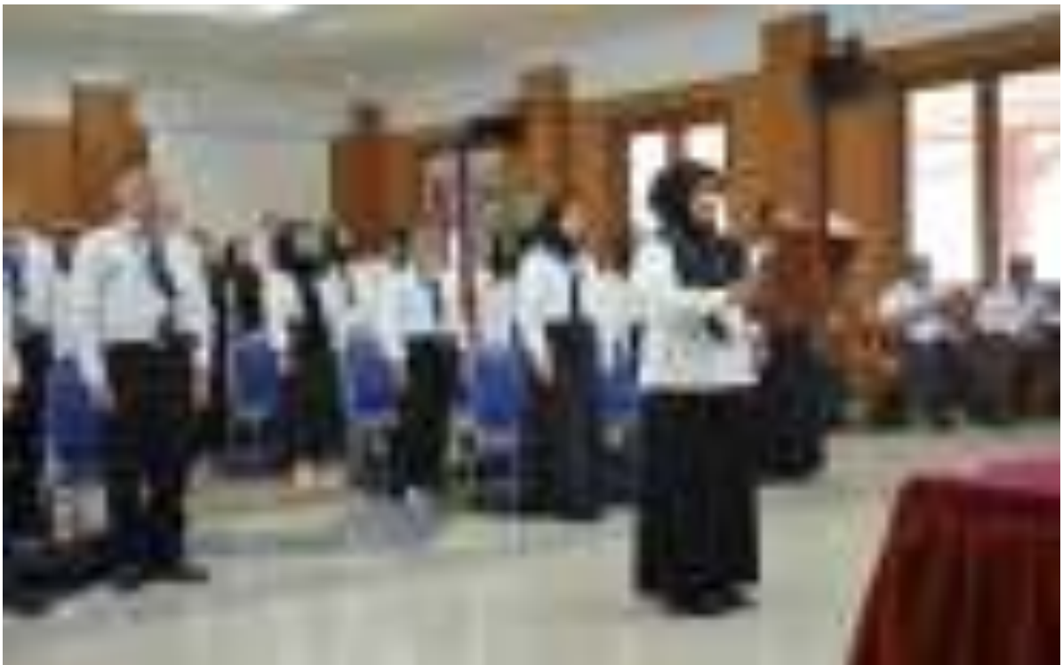
Gambar 3. Pembukaan Fase Klasikal Pelatihan Dasar CPNS Tahun 2023

Penyelenggaraan diklat harus didukung dengan kebijakan dan ketentuan yang akan membuat diklat berjalan dengan lancar serta dapat dipertanggungjawabkan. Pusat Diklat SDM LHK melaksanakan pembuatan draft peraturan yang nantinya akan didiskusikan dan disahkan oleh pejabat yang berwenang. Anggaran yang diperlukan untuk kegiatan tersebut adalah Rp16.308.000,- .