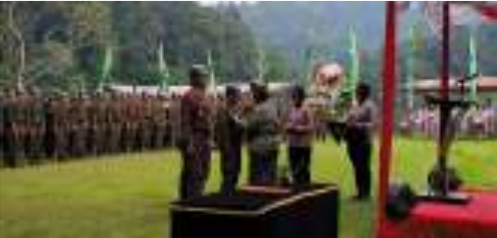
Gambar 5. Penutupan Diklat Pembentukan Polisi Kehutanan Fase Kepolisian