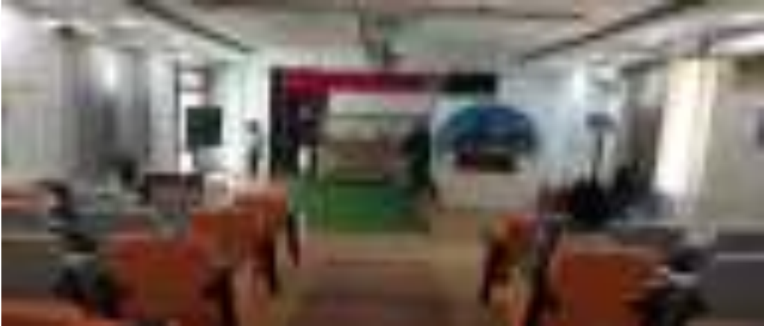
Gambar 18. Ruang Smartclass

Kegiatan ini terkait dengan biaya perawatan gedung agar dapat berfungsi secara optimal sesuai dengan fungsinya yang terdiri dari : pemeliharaan gedung/ bangunan kantor bertingkat, pemeliharaan jaringan listrik, telepon, PAM dan gas, pemeliharaan jaringan LAN dan Internet. Alokasi anggaran untuk kegiatan ini dalam pagu adalah sebesar Rp752.526.000,- .