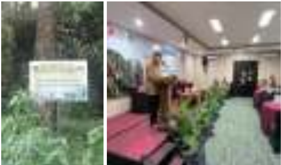
Gambar 4. KHDTK Binaan yang berada di Universitas Brawijaya (Kiri), Seminar Pengelolaan KHDTK (Kanan)

Tim Kerja Pengembangan Pelatihan mempunyai tugas dalam memfasilitasi pengelolaan KHDTK, mengelola kerjasama teknik, mengembangkan metode pelatihan, mengembangkan LMS. Rincian kegiatan sebagai berikut.