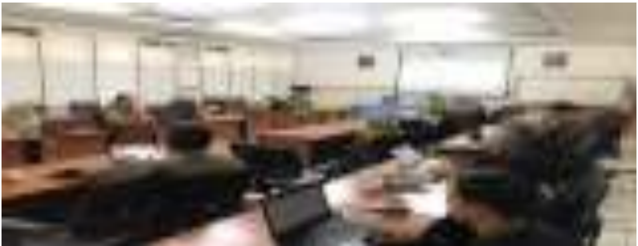
Gambar 13. Kegiatan Bimtek Akreditasi Lembaga Diklat dan Program Pelatihan Bidang Lingkungan Hidup dan Kehutanan

Pusat Diklat SDM LHK juga melakukan Akreditasi kepada lembaga-lembaga penyelenggara pelatihan AMDAL, hal tersebut bertujuan agar Lembaga yang menyelenggarakan pelatihan mempunyai kompetensi untuk menghasilkan lulusan pelatihan yang baik. Anggaran yang diperlukan sebesar Rp6.000.000,- .