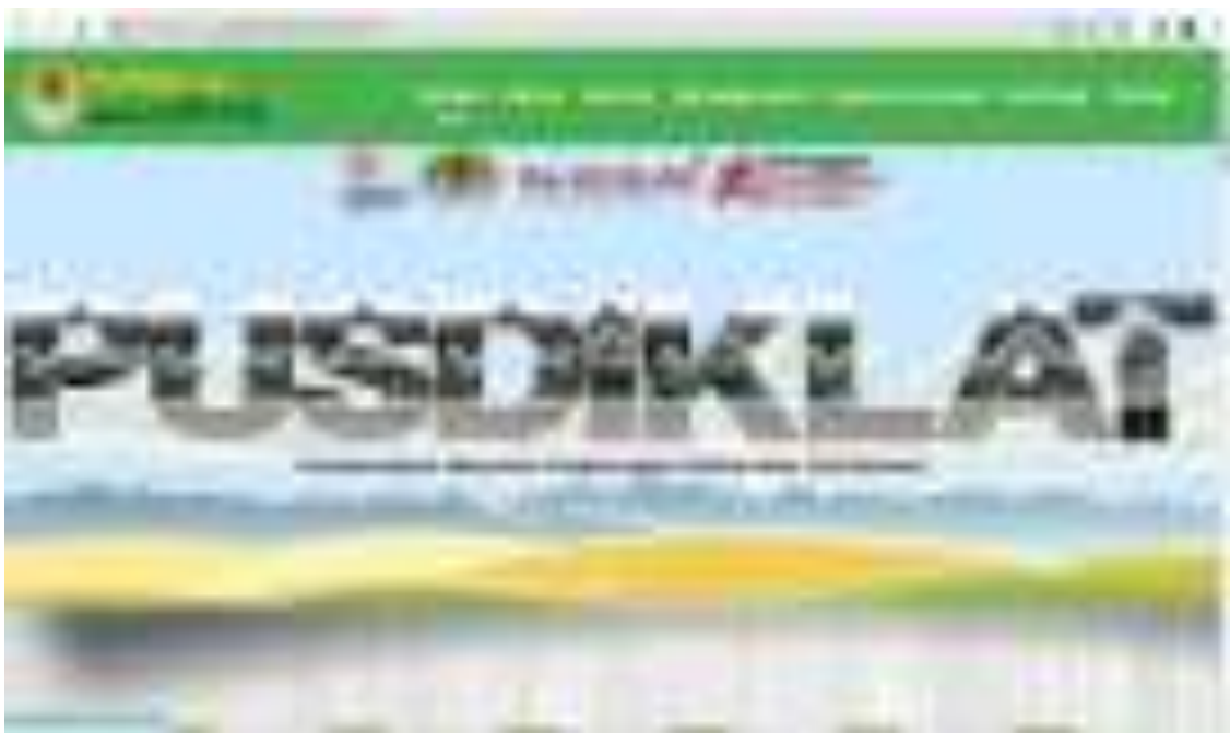
Gambar 20. Website https://pusdiklat.bp2sdm.menlhk.go.id/

Dalam rangka menunjang pengelolaan berkas yang ada di Pusat Diklat SDM LHK baik berkas yang lama maupun yang baru, kegiatan pengelolaan berkas dilaksanakan dalam rangka meminimalisir berkas-berkas yang hilang ataupun rusak. Anggaran dalam pagu sebesar Rp9.140.000,-