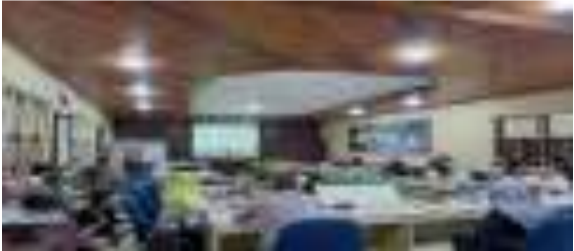
Gambar 15. Kegiatan SNM ISO 9001;2015