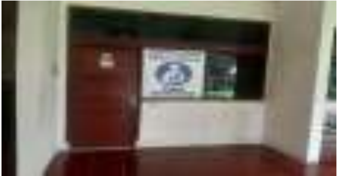
Gambar 19. Ruang Laktasi di Asrama Pusat Diklat SDM LHK