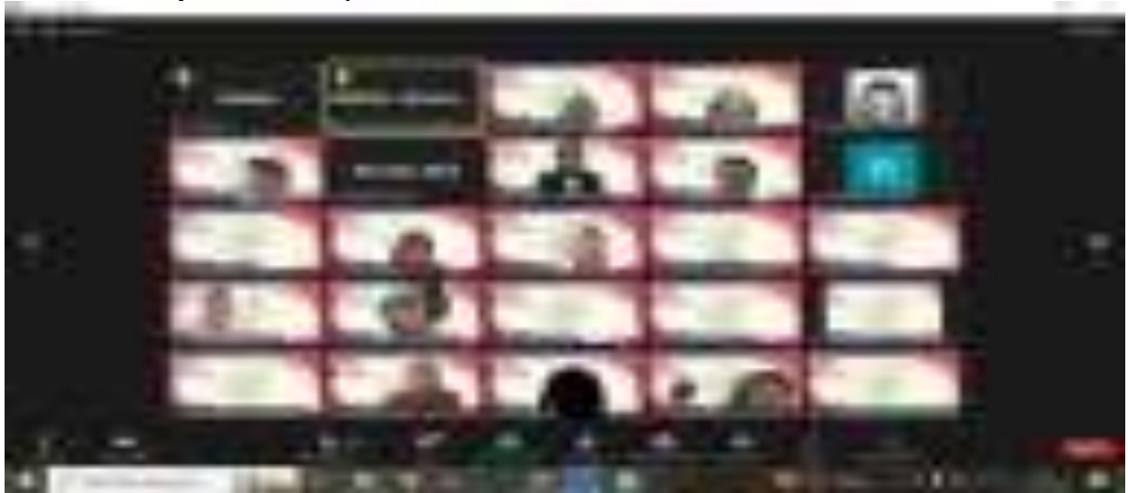
Gambar 14. Kegiatan Sosialisasi MOOC Pengarusutamaan Gender tahun 2023

permasalahan dalam penyelenggaraan diklat dan merumuskan penyelesaiannya sebagai bahan perbaikan dan penyempurnaan kualitas pelaksanaan diklat ke depan. Kegiatan ini terdiri dari : Penyusunan laporan bulanan, triwulan, semester, tahunan, LKj, dan penyusunan statistik diklat. Anggaran untuk kegiatan ini dalam pagu tahun 2024 adalah sebesar Rp62.650.000,- .