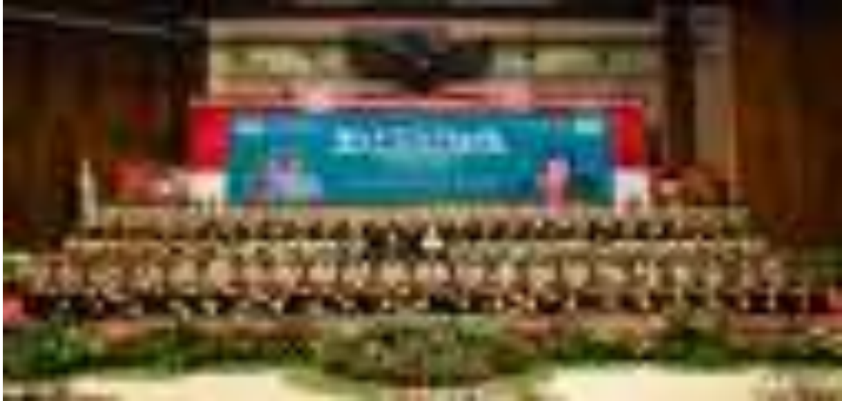
Gambar 12. Kegiatan Wisuda Akbar SMK Kehutanan Negeri di Manggala Wanabakti

Anggaran untuk membiayai kegiatan ini adalah sebesar Rp2.719.934.000,-