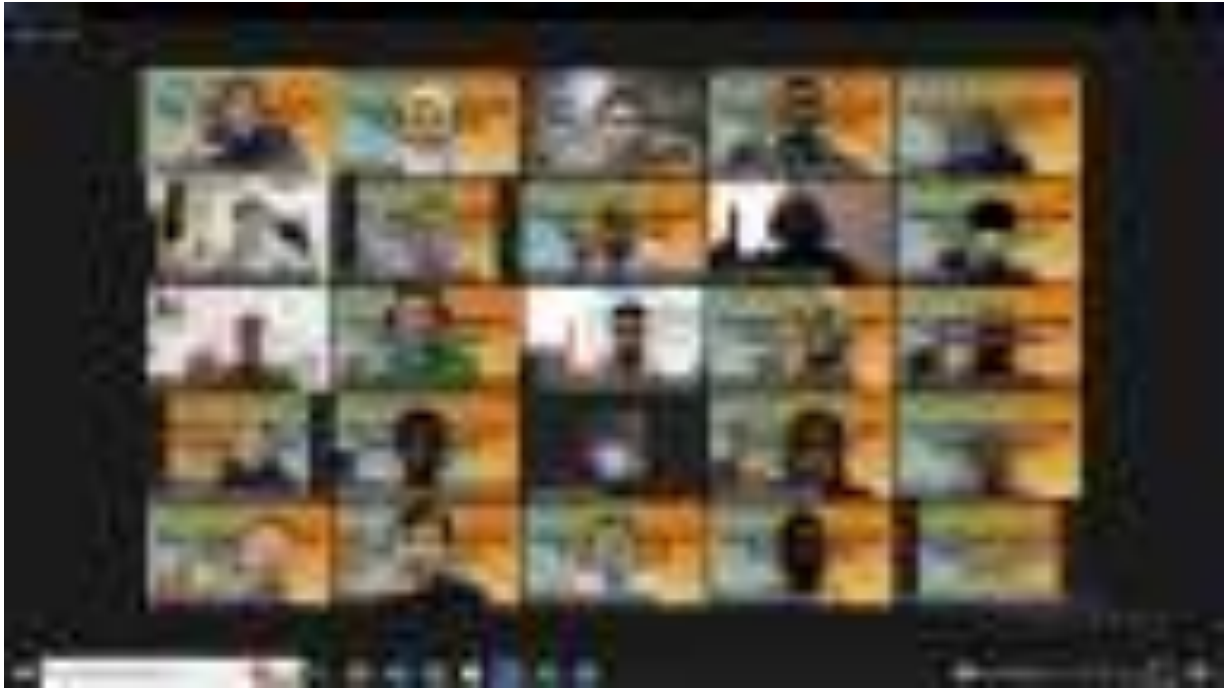
Gambar 9. Kegiatan Pelatihan Ganis PH Perencana Hutan secara Blended Learning