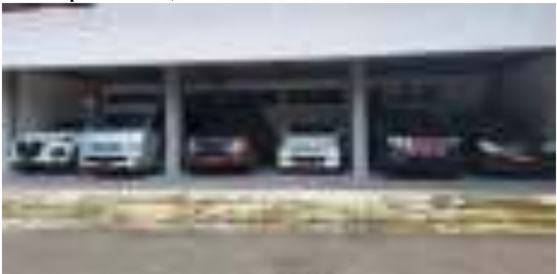
Gambar 17. Kendaraan Inventaris Pusat Diklat SDM LHK

Kendaraan merupakan salah satu unit pendukung pelaksanaan kegiatan organisasi yang sangat diperlukan keberadaannya. Oleh karenanya agar dapat tetap berfungsi dengan optimal perlu dilakukan pemeliharaan dengan kegiatan berupa perbaikan, rehabilitasi, pembayaran pajak kendaraan bermotor, dan penyediaan bahan bakar. Perawatan meliputi: kendaraan pejabat Eselon II, kendaraan operasional roda-4, pemeliharaan kendaraan operasional roda-2, biaya pemeliharaan dan operasional Kendaraan Roda 6 serta biaya pemeliharaan dan operasional kendaraan operasional lapangan (double gardan). Alokasi anggaran untuk kegiatan ini dalam pagu adalah sebesar Rp469.600.000,-