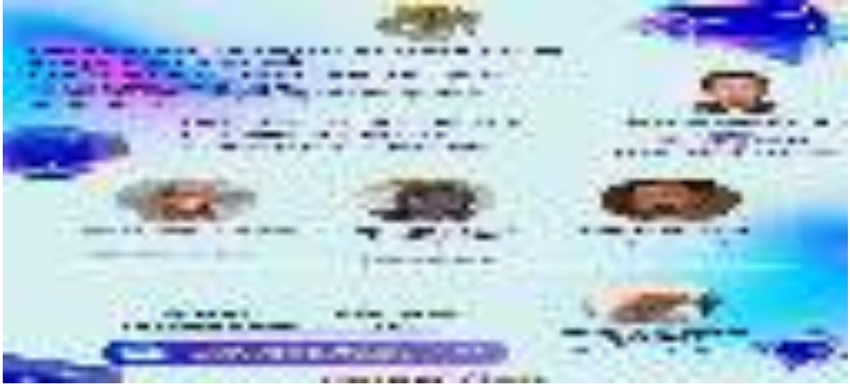
Gambar 11. Kegiatan Presentasi Hasil Studi karyasiswa secara blended

S2 dan S3. Pada tahun 2023 anggaran untuk kegiatan ini sebesar Rp358.600.000,- .