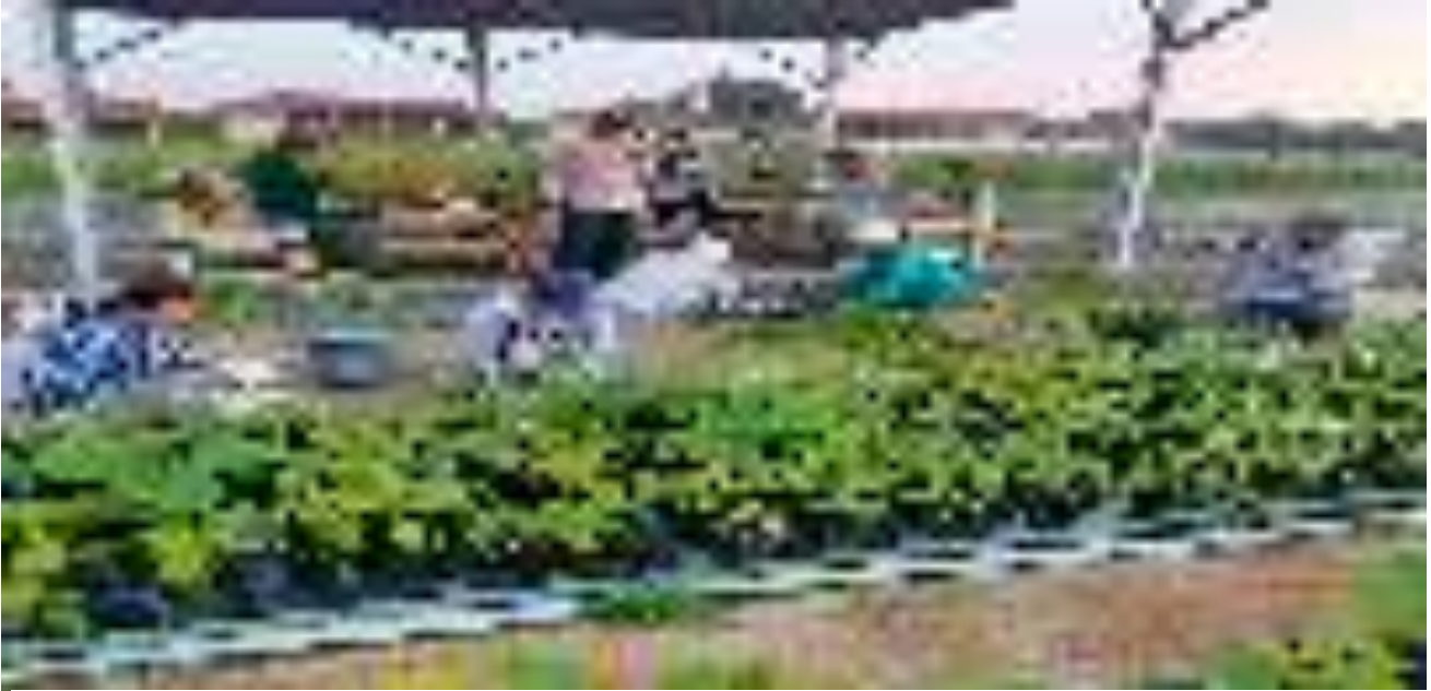
Gambar 8. Praktek Lapangan Pelatihan Penilaian Mutu Bibit Tanaman Hutan Kerjasama dengan Direktorat Pembenihan Tanaman Hutan