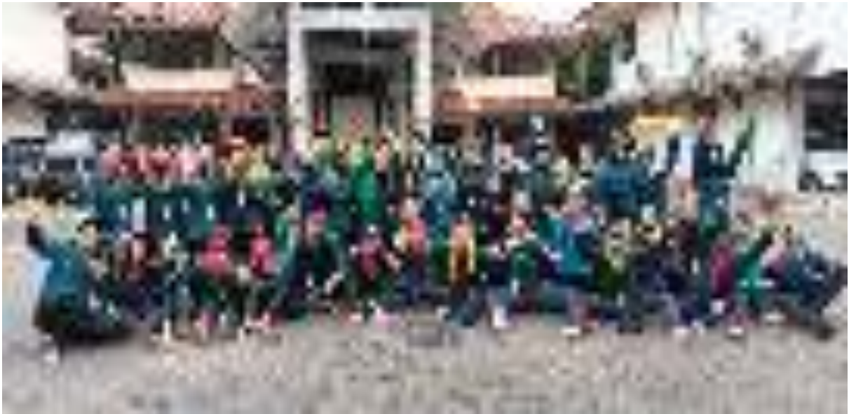
Gambar 10 Kegiatan Orientasi PPPK Gelombang II