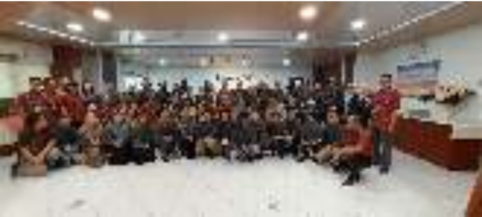
Gambar 6. Praktek Lapangan di PT. Indofood pada Pelatihan PPLH Angk. 2