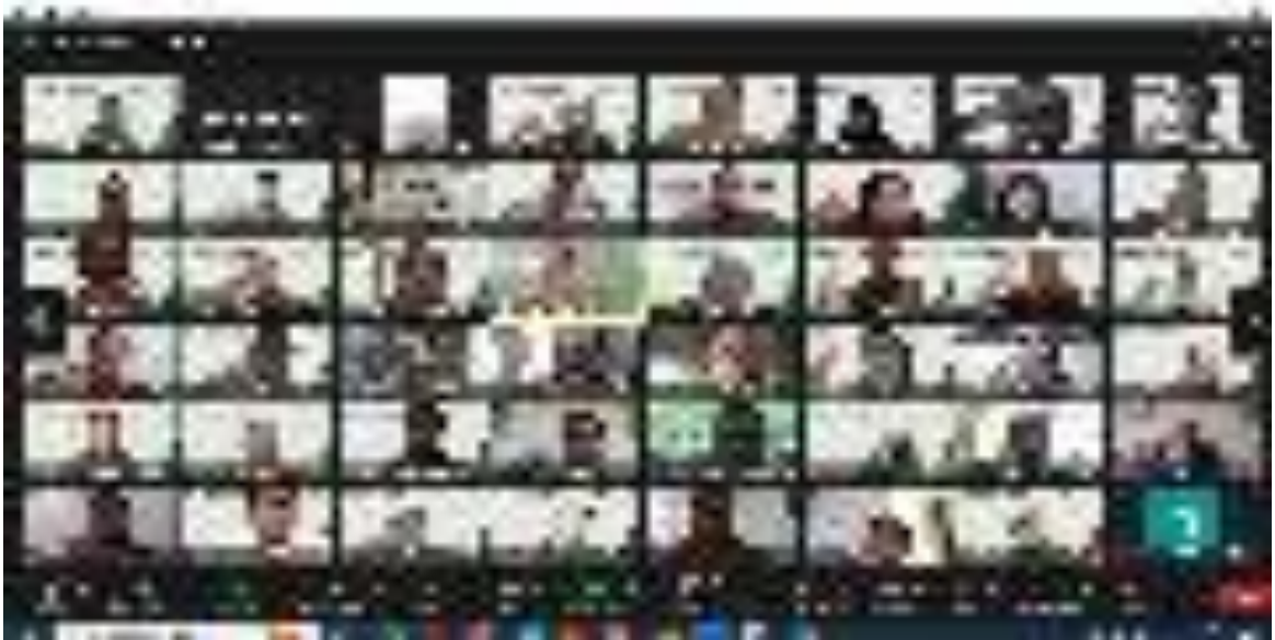
Gambar 7. Pelatihan Dasar-Dasar AMDAL secara E-Learning

Sasaran kegiatan adalah 60 orang peserta selama 11 Hari secara Blended Learning . Anggaran yang diperlukan Rp219.558.000,- .