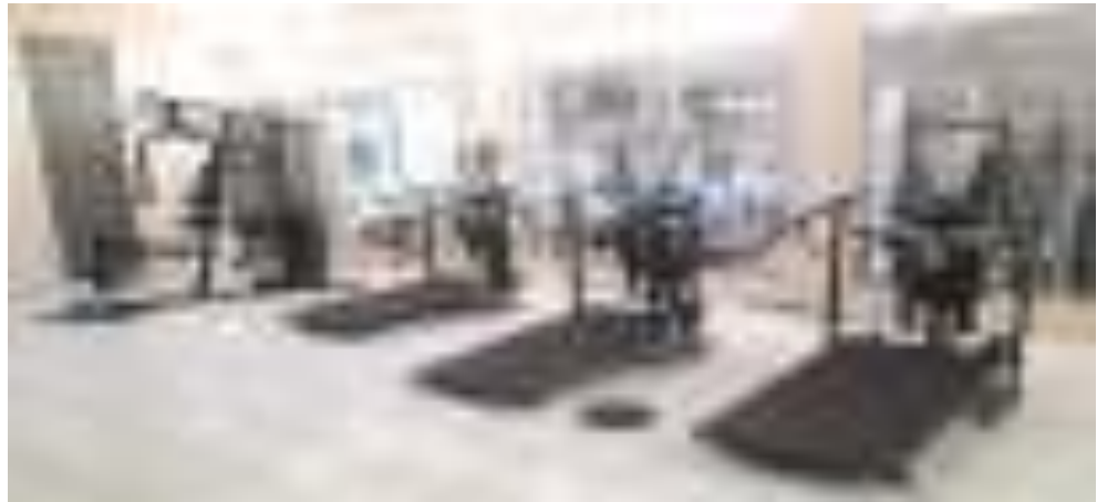
Gambar 13. Sarana Olahraga Indoor dan outdoor Pusat Diklat SDM LHK