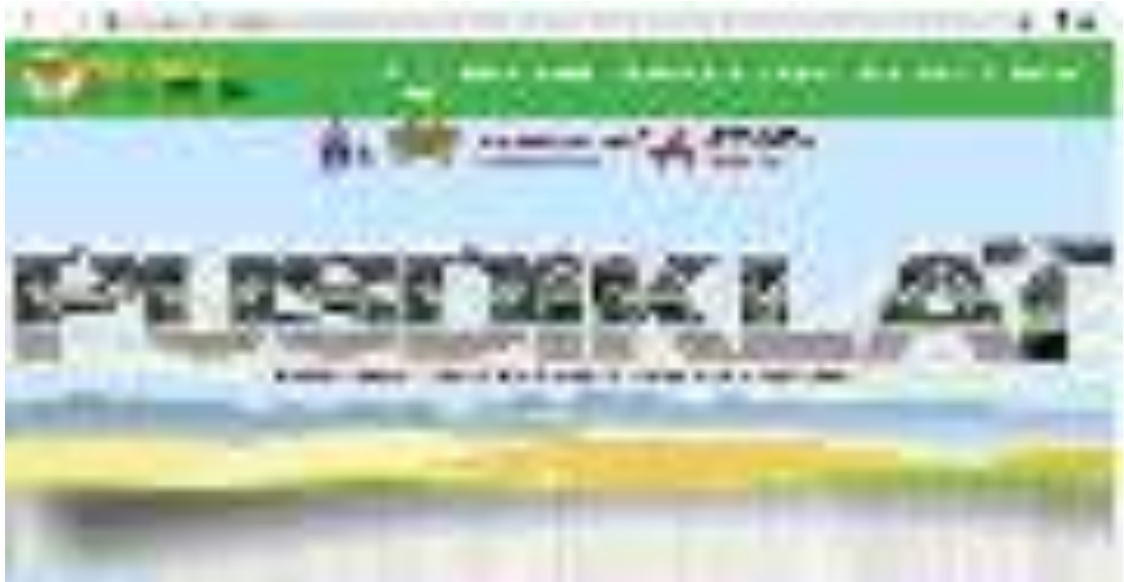
Gambar 17. Website https://pusdiklat.bp2sdm.menlhk.go.id/