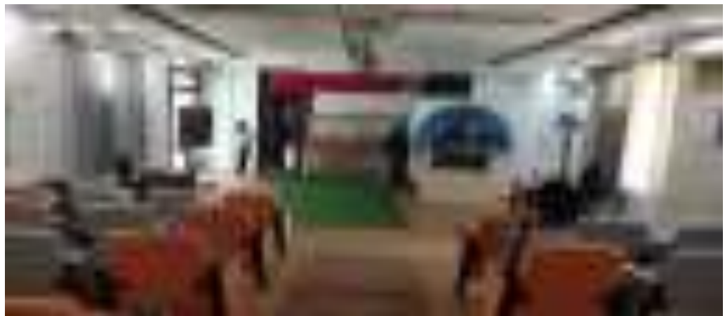
Gambar 15. Ruang Smartclass