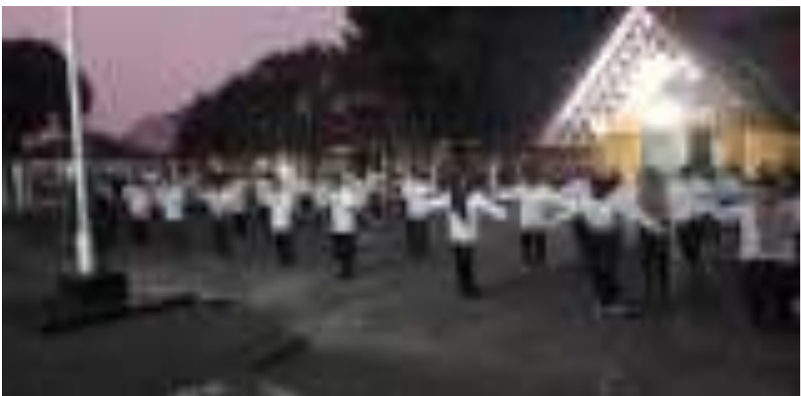
Gambar 7. Kegiatan Pelatihan Dasar CPNS Secara Klasikal