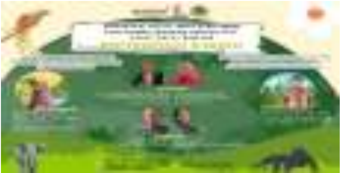
Gambar 8. Kegiatan Presentasi Hasil Studi karyasiswa secara online

a. Pengelolaan Pendidikan Lantutan. Kegiatan tersebut untuk menunjang kegiatan Karyasiswa untuk mempertanggungjawabkan hasil studi para pegawai yang mendapat karyasiswa. Anggaran yang diperlukan adalah Rp56.020.000.