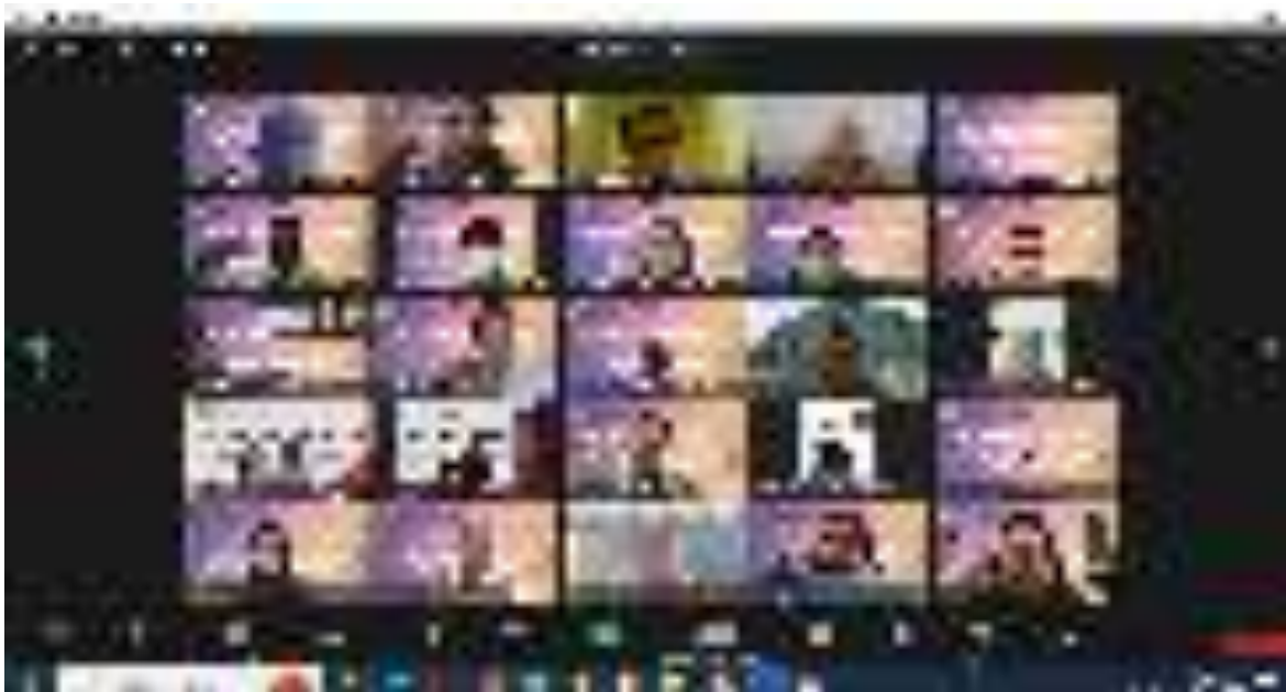
Gambar 2. Pembukaan Pelatihan Pengukuran dan Pemetaan Batas Kawasan Hutan dan Dasar-Dasar Amdal