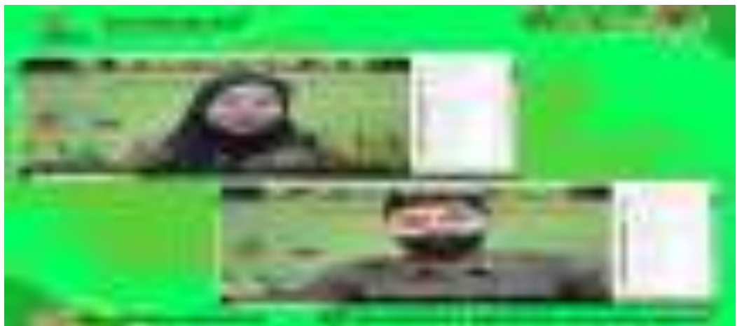
Gambar 4. Pelatihan Dasar-Dasar AMDAL secara E-Learning