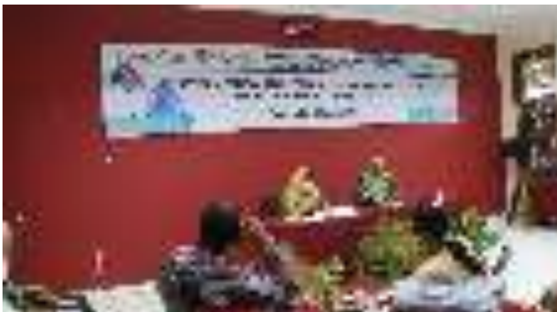
Gambar 5. Kegiatan Pelatihan Pengolahan Sampah Budidaya Maggot