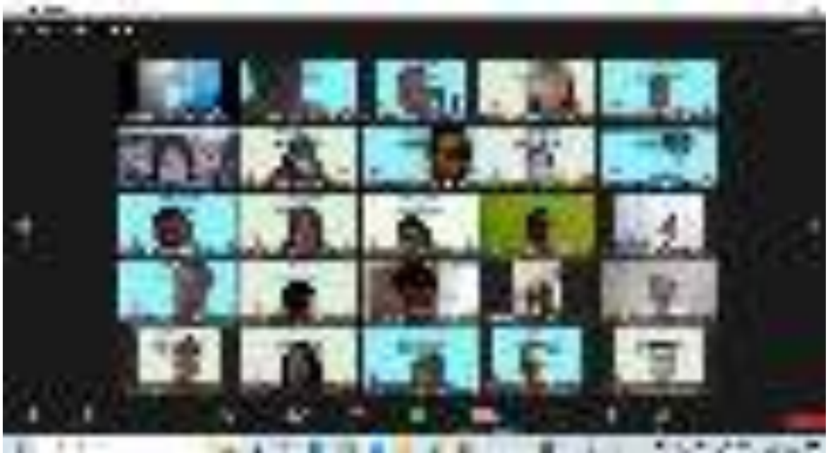
Gambar 3. Pelatihan Penyuluh Kehutanan secara E-Learning