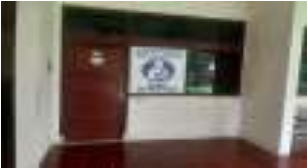
Gambar 16. Ruang Laktasi di Asrama Pusat Diklat SDM LHK