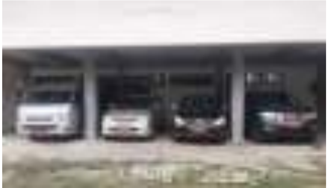
Gambar 14. Kendaraan Inventaris Pusat Diklat SDM LHK