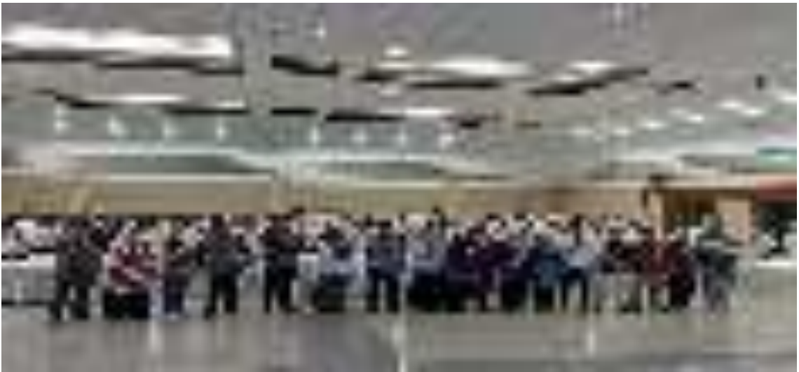
Gambar 12. Kegiatan Benchmarking Pusat Diklat SDM LHK dengan BPSDM Provinsi Jawa Barat Sumber : Dokumentasi Sub Bagian Tata usaha

2. Pelatihan Bidang SDM LHK (DCE) , dengan Rincian Output (RO) adalah Pelatihan SDM Aparatur LHK yang ditingkatkan, Adapun Komponen Kejadiannya adalah Pendukung Kediklatan dengan rincian kejadiannya adalah sebagai berikut: