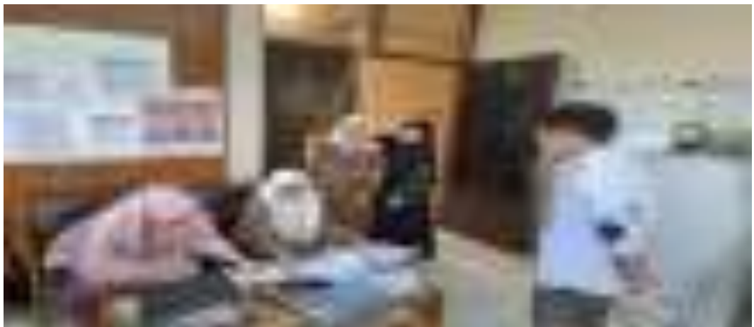
Gambar 11. Kegiatan Pendampingan Penerapan SMM ISO 9001 : 2015 dari Tim Konsultan