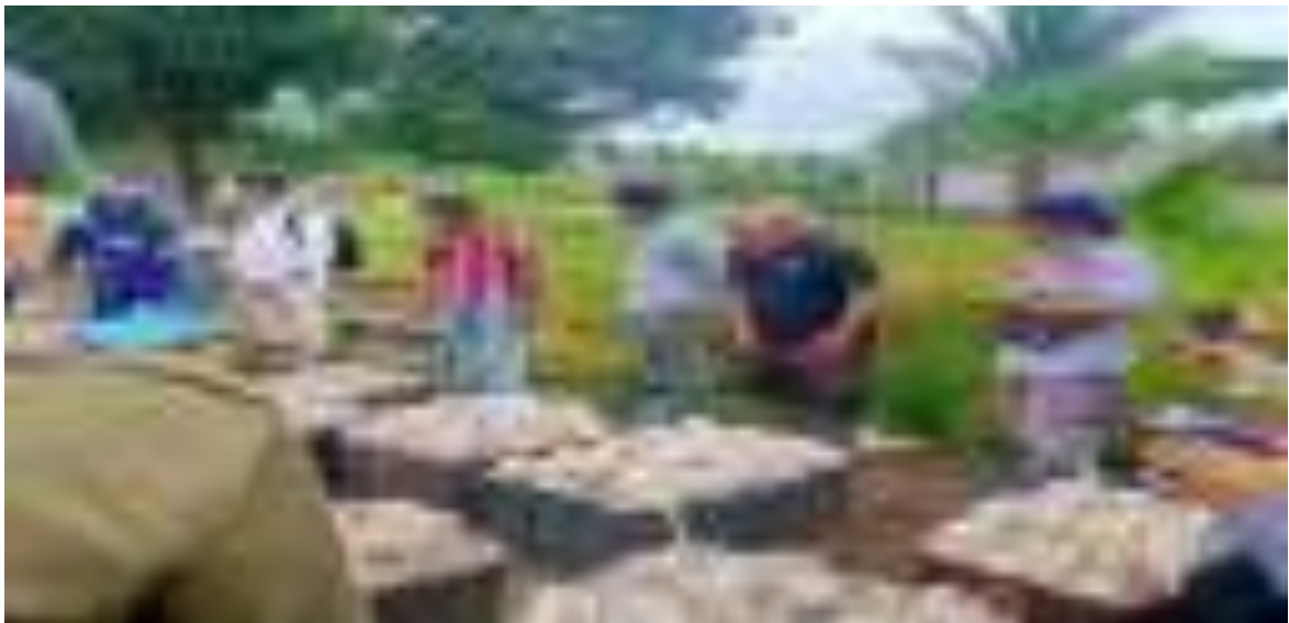
Gambar 6. Kegiatan Pelatihan Tenaga Teknis Pengelola Hutan HHBK Kelompok Getah