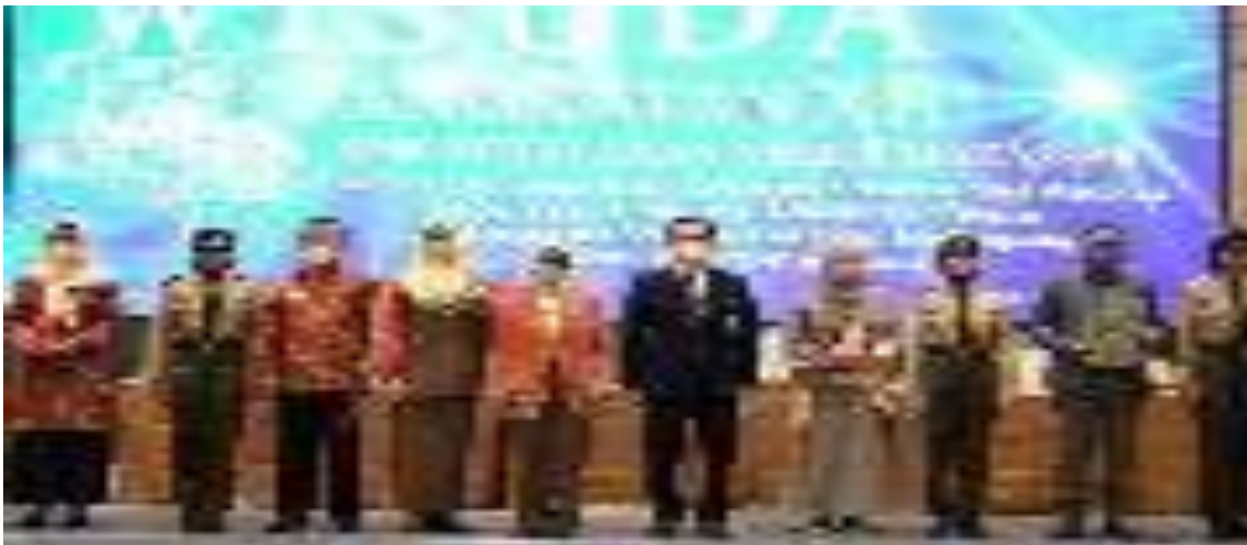
Gambar 9. Kegiatan Wisuda SMK Kehutanan Negeri Makassar

2. Pelatihan Bidang SDM LHK (DCE), dengan Rincian Output (RO) adalah Pelatihan SDM Aparatur LHK yang ditingkatkan, Adapun Komponen Keegiatannya