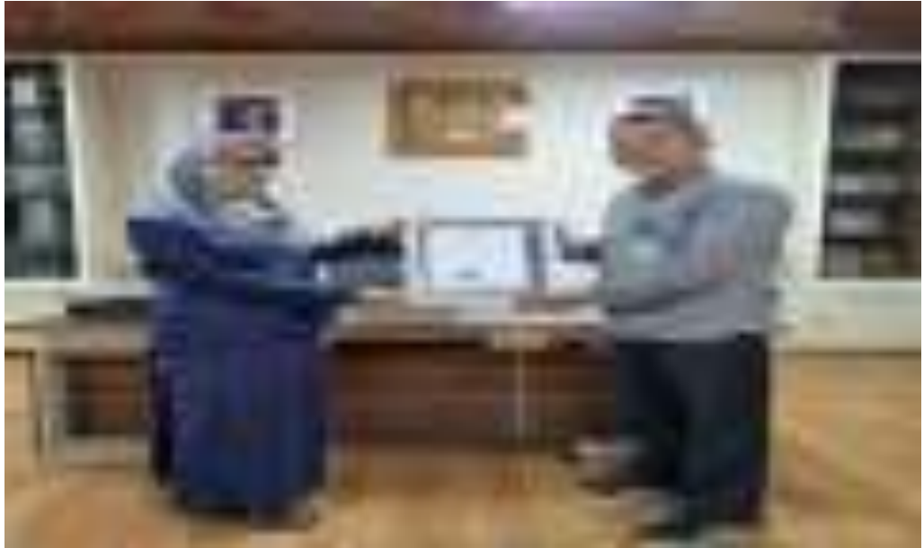
Gambar 10. Pusat Diklat SDM LHK mendapatkan predikat ISO 9001:2015

dan kepuasan pelanggan. Alokasi anggaran untuk kegiatan ini dalam pagu adalah sebesar Rp82.069.000,- .